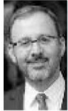
Mehmet Muharrem Kasapoğlu

Gençlik ve Spor Bakanı Mehmet Mu- harrem Kasapoğlu korona virüsü nede- niyle kritik sürecin en müspet şekilde atlatılacağını ifade etti. Gençlik ve Spor Bakanlığı'na bağlı yurtların, millet için ha- kiki bir yuva olacak şekilde hizmet verdiği- ni vurgulayan Bakan Kasapoğlu, yurtlarda