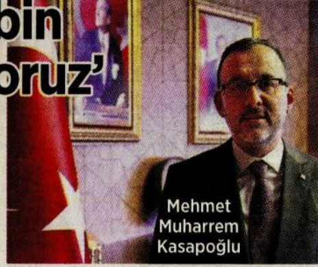
Mehmet Muharrem Kasapoğlu

hakiki bir yuva olacak şekilde hizmet verdiğini vurgulayan Kasapoğlu, şunları söyledi: “Yurtlarımızda 14 günlük karantina sürelerini tamamlayarak ayrılan vatandaşlarımıza sağlıklı ve huzur dolu günler diliyorum. Onların bu süreyi en iyi şekilde geçirmeleri adına elimizden gelen bütün gayreti gösterdiğimizi özellikle belirtmek istiyorum. Bu anlamda bütün çalışma arkadaşlarıma şükranlarımı su-